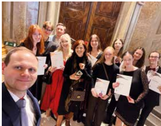
Ocenění absolventi programu DofE s paní ředitelkou a vyučujícími.