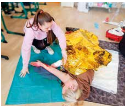
Věrohodnost zranění byla zajištěna spoluprací s Českým červeným křížem.

V pondělí 20. března 2023 se konalo školní kolo soutěže v první pomoci. Akce se zúčastnili žáci 2. ročníku oboru Praktická sestra. Celkem soutěžilo 10 čtyřčlenných týmů. Na naše „záchranáře“ čekaly tři modelové situace, v rámci kterých ošetřili infarkt myokardu, hysterii, epilepsii, popáleniny, zlomeniny a masivní krvácení. Součástí soutěže byl i písemný test.