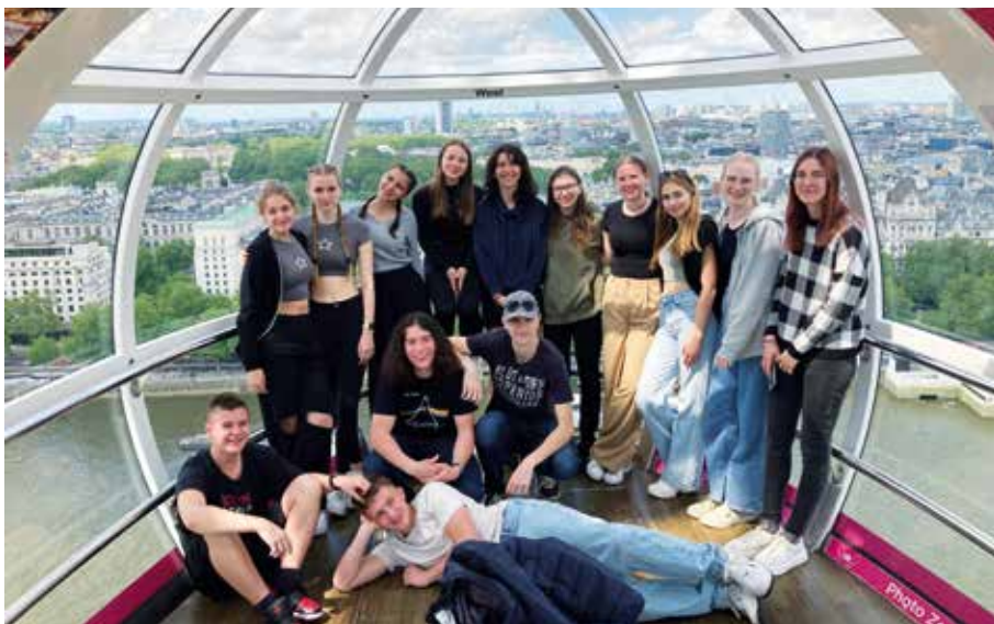
Oko nad Londýnem aneb Exkurze žáků naší školy do Londýna, která proběhla ve dnech 12. až 16. května 2024.

Dne 15. května 2024 probíhala sběrka v rámci Českého dne proti rakovině . Zakoupením kvítku měsíčku bylo možné podpořit činnost Ligy proti rakovině, která se věnuje nádorové prevenci, zlepšování života onkologických pacientů, podporuje onkologický výzkum a přispívá k vybavenosti onkologických pracovišť. Naši žáci oboru Praktická sestra se vydali do ulic a prodávali tyto kvítky.