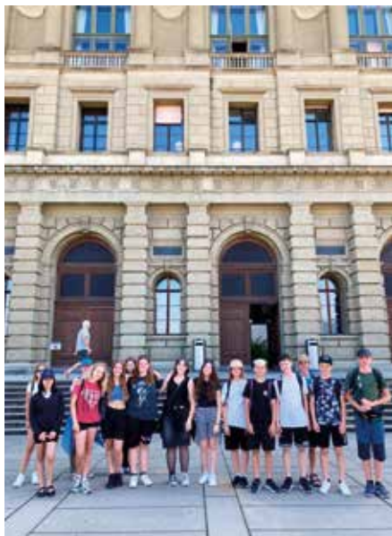
Vysoká škola polytechnická, na které studoval a později také přednášel A. Einstein.

zeli vysokou technickou školou, kde studoval a později učil Albert Einstein. A tady jsme viděli curyšské prostředí vysokoškoláků. Jejich studovny. Jejich WC. Jejich jídelny a kavárničky. A zpestřením bylo nejmenší muzeum Alberta Einsteina na světě: šatní skříňka s jeho fotkami a osobními věcmi.“