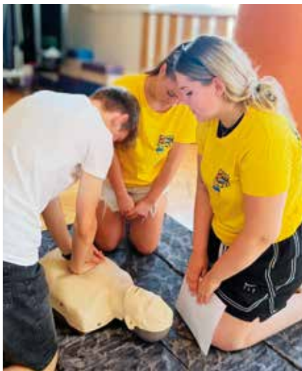
Ukázka první pomoci žákům na ZŠ Komenského v Kyjově.