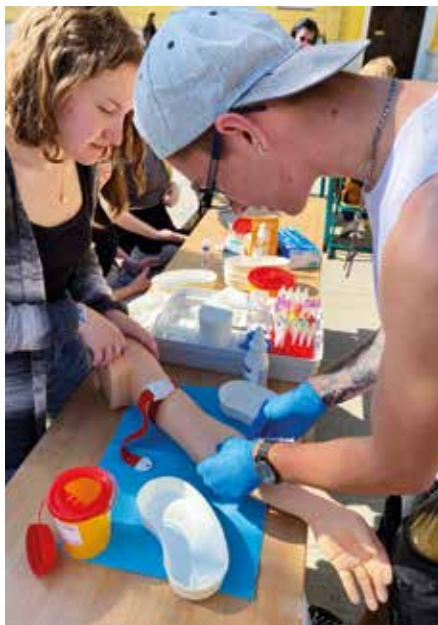
Zkouška odběru krve na umělé paži.

Děkujeme všem zájemcům a také žákům a vyučujícím, kteří se na akci podíleli!