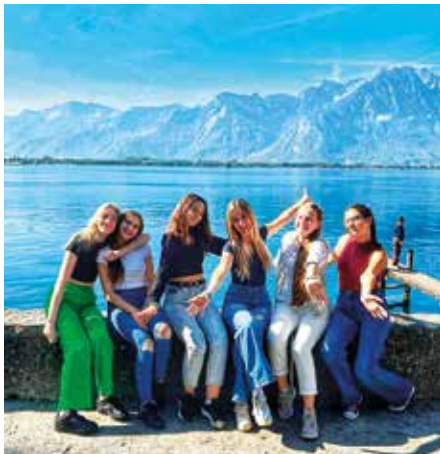
Zastávka u Ženevského jezera.

Zlatým hřebem celého zájezdu byla čtvrtěteční návštěva CERNu, kde se nachází největší urychlovač částic na světě. Evropská organizace pro jaderný výzkum (původně francouzsky Conseil Européen pour la recherche nucléaire, CERN) je mezinárodní organizace se sídlem v Ženevě zabývající se částicovou fyzikou. Po vydatném obědě v místní restauraci jsme se přesunuli místní „šalinou“ – ženevským vlakem – do centra města, kde nás paní průvodkyně opět upozornila na památky a zajímavosti Ženevy včetně její dominanty vodotrysku Jet d’Eau. Po utracení posledních franků jsme zdárně dorazili ke konci našeho výletu.