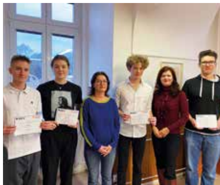
Účastníci letošní ekonomické olympiády se svými diplomy.