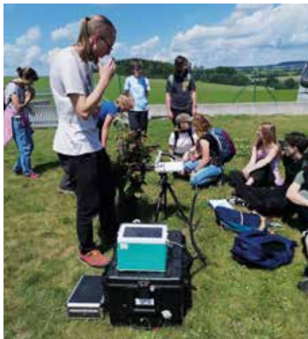
Návštěva experimentálního pracoviště ekofyziologie rostlin Akademie věd ČR.

Domaníněk je unikátní experimentální pracoviště ekofyziologie rostlin, zaměřené na studium zemědělských plodin a způsoby jejich pěstování v podmínkách měnícího se klimatu. Ve speciálních komorách podobných skleníkům (open top chambers) zde zkoumají dopady zvýšené koncentrace CO 2 a jeho vlivu na fyziologické a biochemické procesy sledovaných rostlin. Výzkum je navíc doplněn o studium působení dalších v současnosti velmi významných faktorů, jako je sucho, změna UV radiace a výživy. Zjištěná data jsou využívána k tvorbě