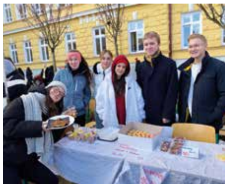
Dobročinnost může mít různou podobu.

i skupinka žáků a pedagogů z kyjovské Střední školy polytechnické. Je jasné, že bez přízně kyjovské a širší rodičovské veřejnosti by se