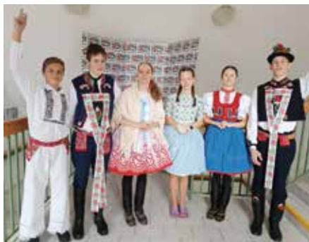
Středa 24. dubna 2024 se nesla ve znamení lidových krojů – ve škole totiž probíhala akce Den v kroji, do které se zapojilo nejen velké množství žáků, ale i někteří učitelé.