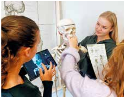
Tablety s programem Anatomyka se výborně osvědčily i při výuce anatomie.

sešity přehledně zařazeny v jedné aplikaci. Psaní zápisů je rychlejší, snadnější a mnohem zábavnější. Zároveň se nemusíme obtěžovat s mnoha psacími pomůckami, ale stačí nám pouze jedna dotyková tužka. Často využíváme možnost rozzdvojení obrazovky, kdy na jedné půlce vidíme zápisy a na druhé obrázky, takže je učení mnohem efektivnější. Při učení somatologie využíváme aplikaci Anatomyka na školních tabletech. Díky 3D provedení máme možnost si každý orgán přiblížit, otočit, zprůhlednit nebo dokonce přidávat nebo ubírat vrstvy. Můžeme si tak lépe představit opravdový tvar a uložení orgánů v těle, což nebylo doposud kvůli 2D obrázkům v učebnici jednoduché. Ke každému orgánu je zároveň napsaný latinský název a popis dílčích struktur, takže už jen samotné „hraní si“ s touto aplikací je pro nás učením. Výhodou je i to, že program je postaven na teoretickém základu skript Memorix anatomie, který je