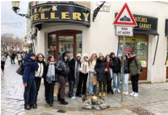
Kromě Kyjova či Brna jsme s našimi hosty z Itálie navštívili také prosincovou Bratislavu.