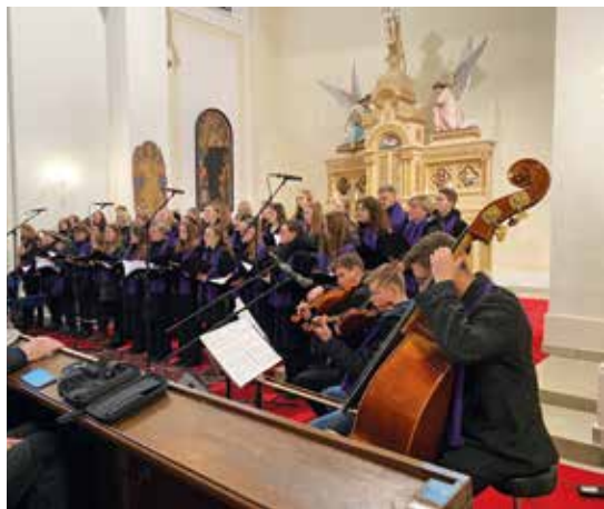
Gymnaziální kaple ožila slavnostními tóny vánočního koncertu.

Dostali jsme spoustu nabídek na další koncerty. A to dokonce tolik, že jsme bohužel z časových důvodů nemohli všechny přijmout. Náš první koncert v novém roce byl ve Svatobořicích-Mistříně, kde z nás byli naprosto nadšeni a kostel byl nacpaný k prasknutí. Poté jsme měli období velikonočních koncertů, což