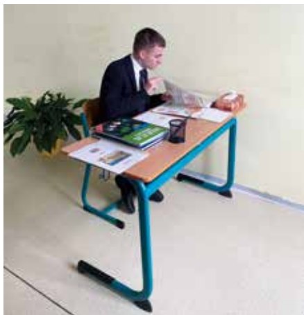
Ústní maturitní zkoušky – příprava na tzv. potítku.

a 10 neprospělo. Během pěti maturitních dnů měly třídy nižšího gymnázia a prvních ročníků zkrácené vyučování v trvání čtyř nebo pěti hodin denně a žáci druhých a třetích ročníků měli ředitelské volno.