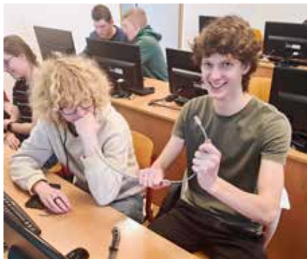
Trénink dělá krimpovačto mistra.

Školní řád zakazuje přinášet do školy nože a jiné zdraví nebezpečné předměty. Toto jsme ale porušili 26. února v hodině informatiky, když jsme si zkoušeli přidat koncovku na síťový kabel. Nejprve jsme pomocí nožičků odstranili nežádoucí ochrannou bužírku. Osm obnažených drátků jsme pak důkladně vyrovnali a pečlivě seřadili podle barev. Na závěr jsme nasunuli a zajistili konektor a bylo hotovo. Výpočetka ale zdaleka není jen o drátech. Programujeme zajímavé úlohy, řešíme logické problémy, a hlavně se učíme přemýšlet. To vše