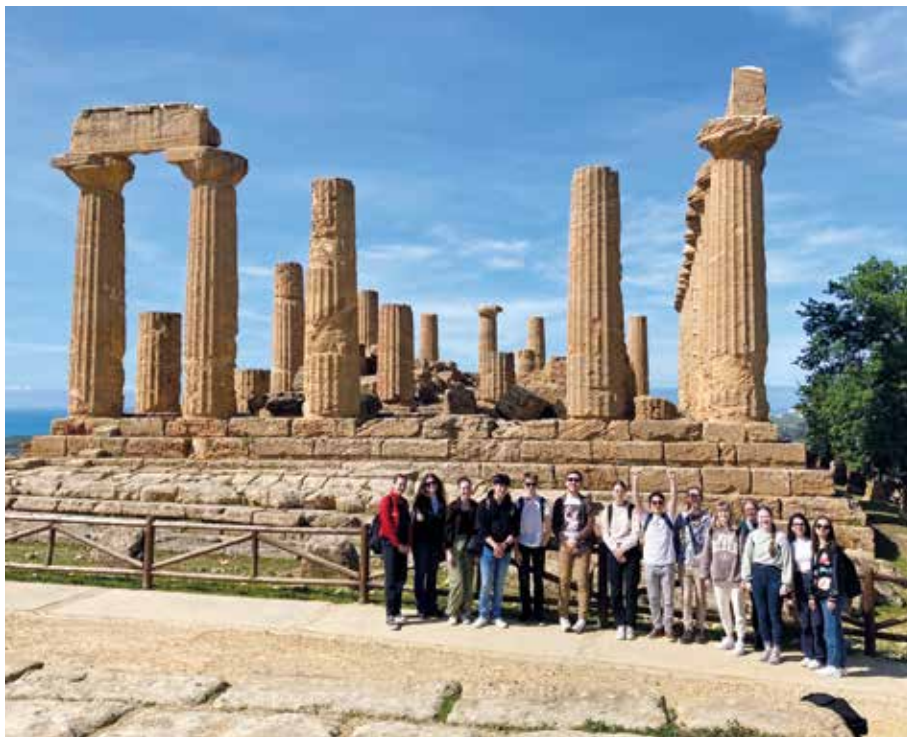
Pozůstatky antického chrámu v sicilském městě Agrigento.