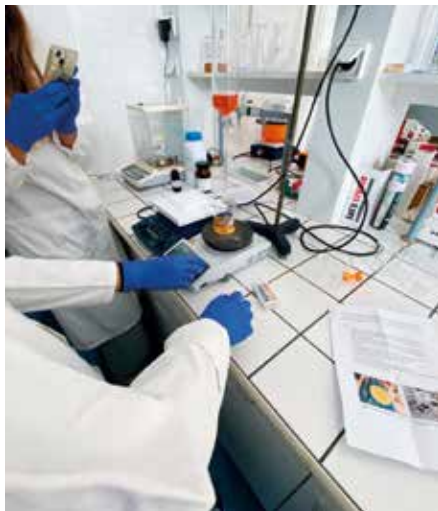
Praktické cvičení ve vysokoškolské laboratoři.

Na programu jsme měli návštěvu přednášek, praktických cvičení, ale i možné konzultace se samotnými vyučujícími. K výběru byly obory matematiky a informatiky, chemie, biologie, fyziky a vědy o Zemi. V jeden podvečer jsme se dokonce sešli se studenty spolku Udržitelný Palacký a ti nám ukázali, jak koleje fungují. Po programech jsme se kochali centrem Olomouce. V závěru jsme za účast dostali osvědčení, ale hlavně jsme si odnesli skvělou zkušenost.