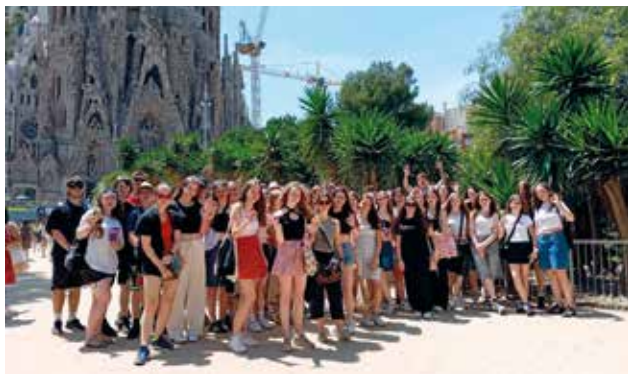
Chrám Sagrada Família s typickým jeřábem v pozadí. Chrám totiž ani po skoro 150 letech od začátku stavebních prací není dokončený.

Sagrada mě tak neuvěřitelně nadchla, že jsem celý den už nemohla myslet na nic jiného. Přála bych každému, aby se do ní aspoň jednou v životě podíval.