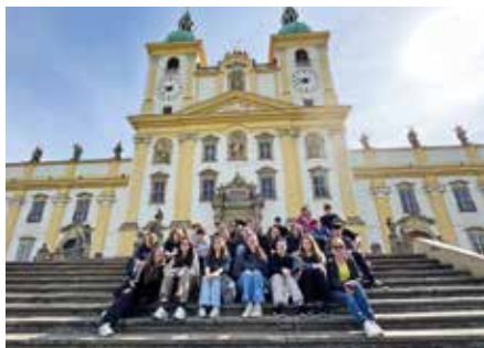
Svatý Kopeček není jen název básně Jiřího Wolкера, ale i místo, kde jsme během terénního kurzu měli hledat kešky.

Tuto otázku si zřejmě položilo i vedení naší školy, a proto uspořádalo ve spolupráci s Univerzitou Palackého v Olomouci pro žáky druhých ročníků terénní kurz. Vyšli jsme se tedy do terénu. Po Olomouci jsme se pohybovali tramvajemi, autobusy nebo pěšky a zjišťovali,