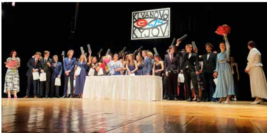
Závěrečná momentka ze slavnostního předání maturitních vysvědčení. Nyní hurá do života!