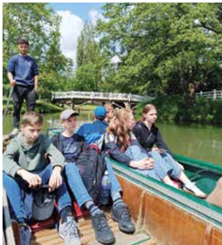
Výlet na loďkách po oxfordském kanálu.

V Londýně nás dále čekal The Tower s královskými koronovačnými klenoty, Tower Bridge, The London Dungeon a také The London Eye. Ve druhé části výletu jsme si vychutnali dechberoucí vyhlídky z mrakodrapu Sky Garden v London City a z moderní věže v Brightonu. Nasbírali jsme mušle u křídových útesů, ochutnali čerstvé fish and chips a užili si turbulentní zpáteční let ze Stansted Airport do Brna.