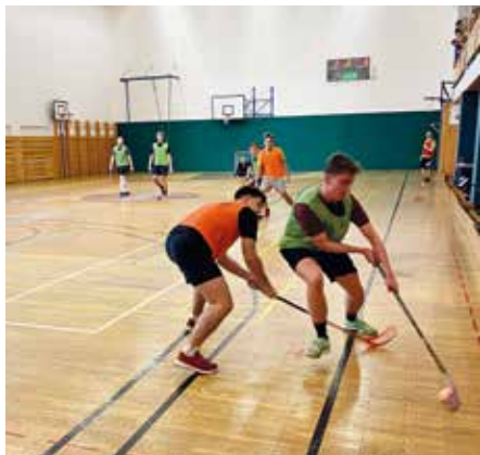
Naši borci v zápalu boje.