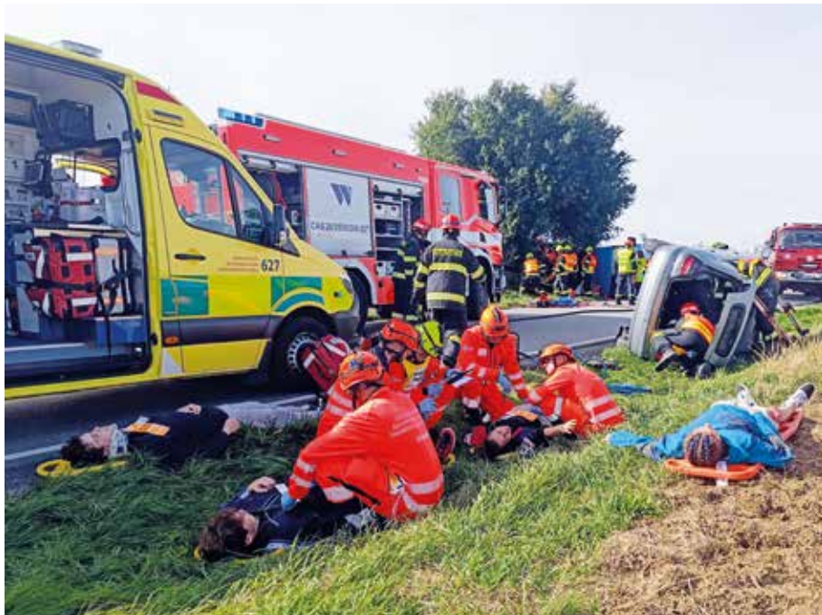
Taktického cvičení složek Integrovaného záchranného systému se naši žáci čtvrtých ročníků oboru Praktická sestra účastnili v roli figurantů.