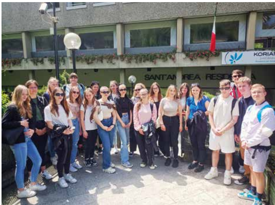
Vybraní žáci třetích ročníků oboru Praktická sestra absolvovali v rámci programu Erasmus+ stáž v Itálii.

Volný čas byl pak časem poznávání. Neomezené kartičky na městskou dopravu nám pomáhaly k snadnějšímu přístupu ke všem