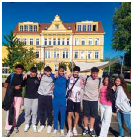
Naši španělští hosté před budovou školy.

Žáci španělštiny pojedou do partnerské školy v andaluské Almerii, proto k nám od 12. května do 18. května 2024 zavítalo devět španělských středoškoláků s ředitelem a dvěma vyučujícími dané školy. Jedním z cílů projektů Erasmus+ je, aby „účastníci vystoupili ze své komfortní zóny“, což naši žáci ze třídy 2.A zakoušeli téměř každodenně. Španělským žákům nabídli ubytování ve svých rodinách. Ovšem časné ranní buzení, cesta do školy v dešti s deštníkem nebo přezouvání se ve škole nebo doma do přezůvek – to vše bylo opravdu náročné a střet kultur byl v mnohých ohledech citelný.