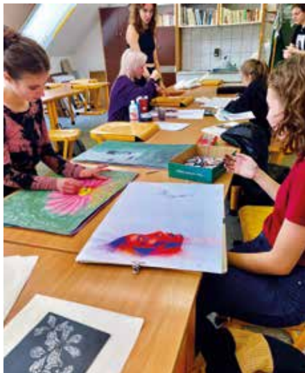
Při prc ve výtvarnm seminři.

vs jenom napadnou, a v hodinch mme jedinenou píleitost si ve vyzkouet a v pípad nezdaru dostat radu, jak n vtvor vylepit.