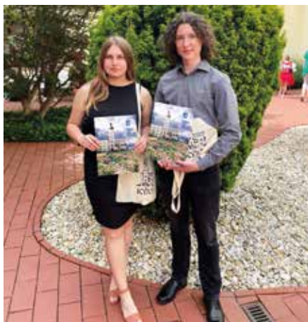
Slavnostní předání ocenění za dobrovolnickou činnost žákům naší školy.

Děkujeme za tuto jejich dobrovolnickou činnost a také za vzornou reprezentaci školy!