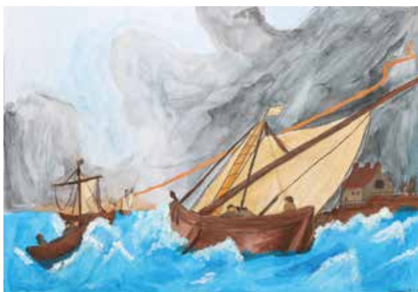
Michaela Grecová, malba temperou

Při předávání cen se vždy četl medailonek každého absolventa, protože cíl každého z nás byl naprosto individuální: výpomoc seniorům v domově důchodců, hraní na hudební nástroje, zaběhnutí maratonu a mnoho dalšího. Součástí ceremonie byly i proslovy dořáků a dořáček, které hezky ilustrovaly unikátní cestu každého absolventa.