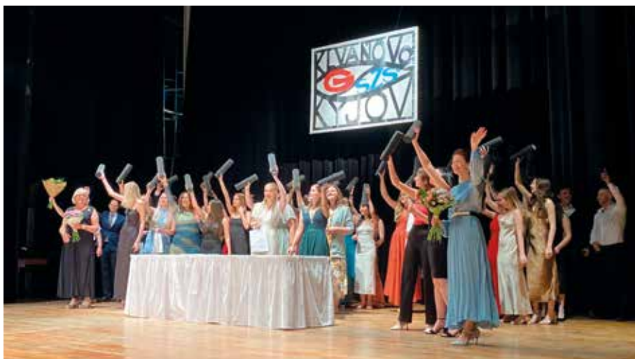
Závěrečná momentka ze slavnostního předání maturitních vysvědčení. Nyní hurá do života!

Všem absolventům gratulujeme a přejeme šťastné vykročení do života!