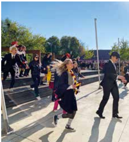
Poslední zvonění maturitních tříd se neslo v radostném duchu a optimismu z blížících se ústních maturitních zkoušek.

Ve dnech 28. dubna až 11. května 2024 se žáci oboru Praktická sestra vypravili v rámci programu Erasmus+ do italského Milána . Během pobytu absolvovali praxi v domově pro seniory Sant'Andrea v Monze a rovněž poznávali okolí a místní zvyklosti.