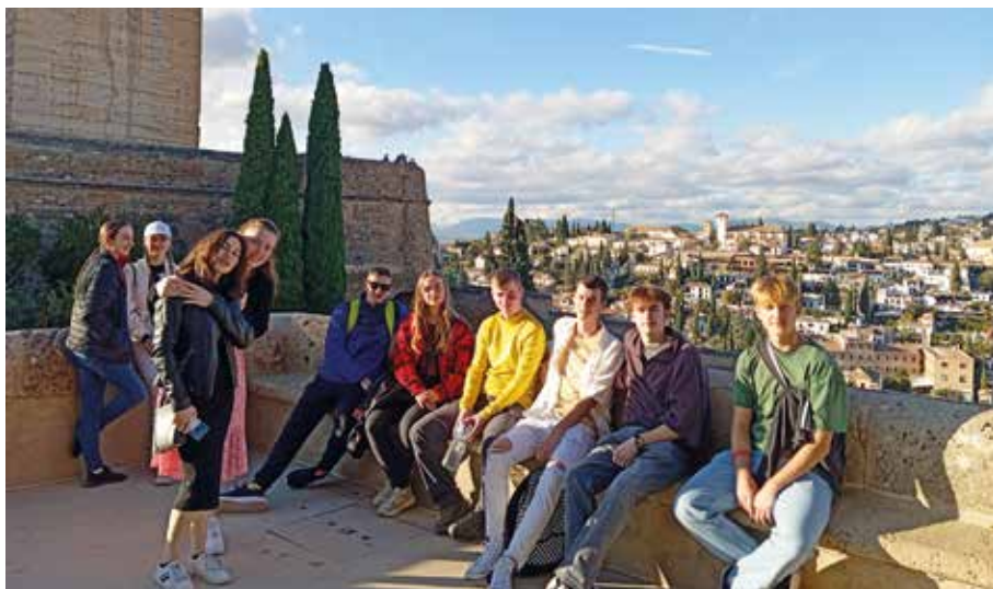
Účastníci mobility v programu Erasmus+ ve Španělsku.

Celý týden byl plný poznávání nových míst, lidí, kultury a mohl být našim žákům nabídnut zcela zdarma díky vedení naší školy a projektu Erasmus+, který poskytuje Evropská unie.