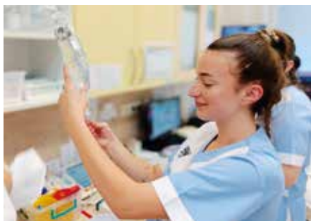
Praktické maturitní zkoušky žáků 4. ročníku oboru Praktická sestra, které se konaly v Nemocnici Kyjov, se všem maturujícím úspěšně povedly.

Dne 17. dubna 2024 se v druhém řádném termínu uskutečnily přijímací zkoušky do osmiletého studia , a to didaktické testy z českého jazyka a matematiky. Téhož dne proběhla ve 14:15 ve školní jídelně porada pedagogického sboru a v 16 hodin se ve sborovně sešli členové výboru SRPŠ.