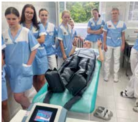
Praktická ukázka použití lymfodrenážního přístroje na žákyni zdravotnického oboru.

přesunuli do ambulantních prostorů, kde je k dispozici fototerapeutická místnost. Ta slouží pacientům s chronickým kožním onemocněním – jde například o lupénku, atopický ekzém, vitiligo nebo akné. Po celou dobu byl výklad doprovázen praktickými ukázkami, které nejenže udržovaly pozornost celé skupinky, ale zvýšily i naše praktické dovednosti. S menší dopomocí vrchní sestry jsme obvazovali bércové vředy a vyzkoušeli si lymfodrenáž. Tato exkurze byla vítaným zpestřením našeho studia.