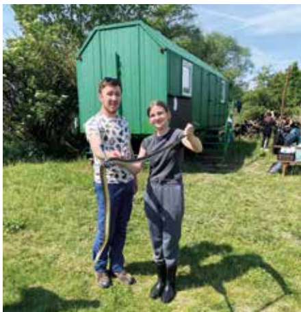
Terénní cvičení ze zoologie v ptačím parku Kosteliska, který se nachází v katastru obce Dubňany.