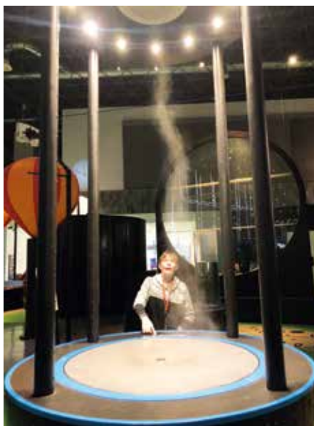
Zázraky fyziky v akci.

Dne 3. května 2024 se žáci primy A vydali na exkurzi do vědecko-zábavního parku VIDA! v Brně. V rozsáhlé expozici si nejprve vyzkoušeli různé interaktivní exponáty z oblasti přírodních věd a mohli si tak objasnit, jak funguje svět kolem nás.